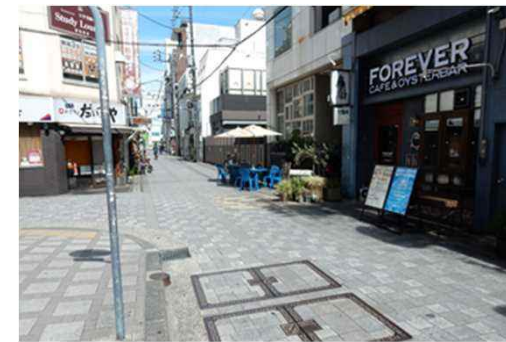
(市道福山駅前2号線)